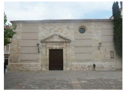
Soledad Church (Palencia)

betrachten. Diese Analyse zielt auf die drei Hauptteile der Gebäude ab, deren Aspekte alle untersucht werden müssen: Den Baukörper, die Schutzhülle und die Oberfläche. Zunächst wurden die Eingriffe in drei große Kategorien eingeteilt, je nach Art des Eingriffs: Erhaltung im Falle des Eingriffs mit dem Ziel der Reinigung, Konsolidierung und dem Schutz des Baukörpers, der Hülle und der Oberfläche; Ausbesserung im Falle von Eingriffen, die neben dem Schutz und der Erhaltung der bestehenden Substanz auch das Füllen kleiner, begrenzter Fehlstellen des Baukörpers, der Hülle und der Oberfläche beinhalten; Wiederherstellung/Erneuerung wenn die Maßnahmen auch in dem Wiederaufbau verloren gegangener Teile bestehen, speziell des Baukörpers oder dessen Hülle, unter Beachtung der Wiederherstellung der ursprünglichen Oberfläche und/oder deren Beschaffenheit. Neben diesen drei Hauptkategorien müssen noch Abriss und andere Eingriffe erwähnt werden.