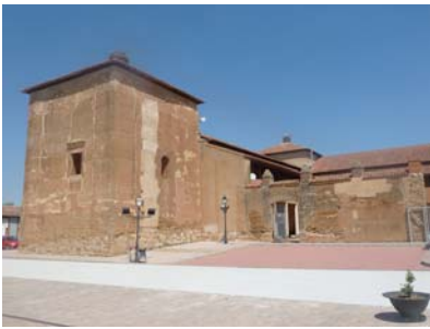
Guzmanes Palace (Léon)