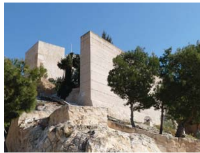
Petrel Castle (Alicante)