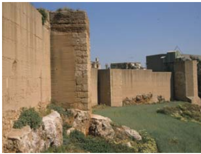
Niebla Walls (Huelva)