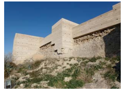
Puerto Lumbrera Castle (Murcia)

and surfaces; reconstruction when the action consists in rebuilding the missing parts, especially in the fabric and copings with a view to recuperating or restoring the surface of the original layout and/or textures. Apart from these three major categories, demolition and other interventions must also be added.