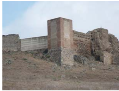
Montemolín Castle (Badajoz)