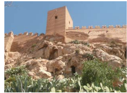
Almería Castle (Almería)