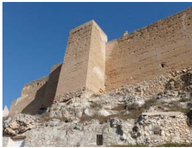
Jorquera Castle (Albacete)