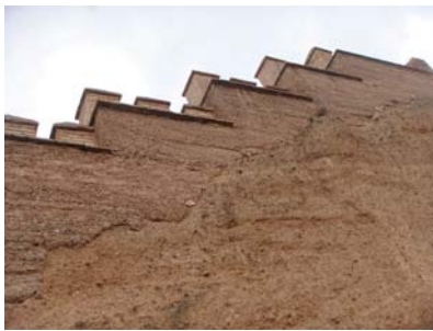
Daroca Walls (Zaragoza)