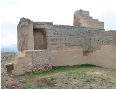
Reina Castle (Badajoz)