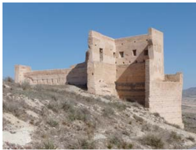
Jumilla Castle (Murcia)