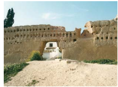
Albaicín Walls (Granada)