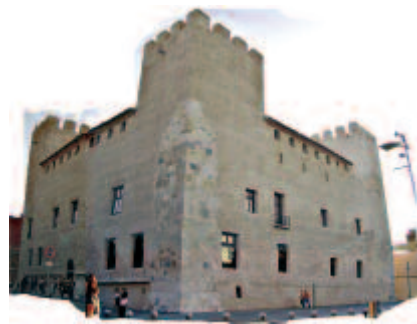
Figura 3. Esempio di un edificio significativo realizzato in tapia valenciana, in cui i muri raggiungono i 15 m di altezza; Castillo de Alaquas, Valencia. (Cristini-Ruiz).

Un altro punto importante da analizzare è quello proprio della distribuzione delle