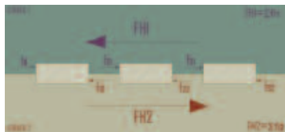
Figura 4. Schema dell'equilibrio delle forze di attrito grazie all'utilizzo di "mattoni connettori" all'interno degli strati di terra cruda pressata. (Cristini-Ruiz).

L'effetto di connessione, riportabile a quello metaforico di una "cerniera lampo" permette di unire strati di terra pressata e assicura anche uno straordinario sviluppo in altezza dei muri, che in alcuni casi arrivano fino a 15-16 m (si consideri ad es. il Castello di Alaquas , nelle immediate vicinanze di Valencia). Questa tecnica non va però interpretata solo come miglioramento delle qualità strutturali: la finitura " todo en uno ", ovvero la formazione di un rivestimento continuo durante la fase costruttiva, è un ulteriore traguardo che si ottiene con l'applicazione di tale metodica. Non serve infatti una finitura/rivestimento a posteriori: dopo aver rimosso il cassero, la crosta di calce subisce il processo di carbonatazione all'aria e costituisce la superficie a vista del muro.