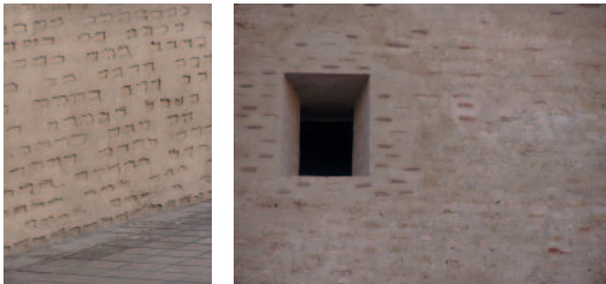
Figura 5. Esempio di edilizia residenziale realizzata in tapia valenciana , esempio di restauro delle superfici non rispettoso delle finiture storiche, dettagli dettagli dell' Alqueria de Chirivella , Valencia (Cristini-Ruiz).

mente e autenticamente il processo costruttivo, dove la forma dei moduli scaturisce direttamente dalla funzione svolta dai mattoni. La finitura del muro riflette il ritmo regolare e modulare dei mattoni, in un sottile gioco di chiaro-scuro, ombra e luce, piani sfasati e texture vibrante, che valorizza la superficie, distinguendola dalla uniformità neutra dei muri di terra tradizionali.