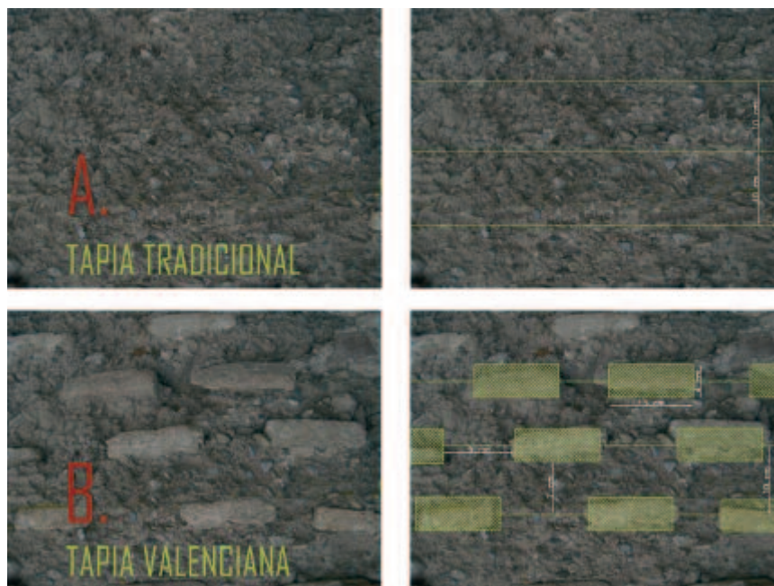
Figura 1. Diferenza degli strati in un modulo di muri in terra tradizionali A) o in tapia valenciana B) (Cristini-Ruiz).

Si parla, anche se non esistono documenti scritti, di una possibile connessione tra le murature realizzate con cementi “poveri” e casseri di origine tardo romana, con i muri di tapia valenciana (Serra Desfilis, 2006, p. 72).